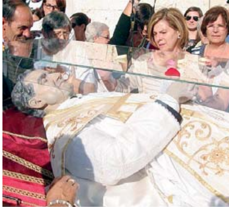
I fedeli a fianco alla statua di Don Bosco